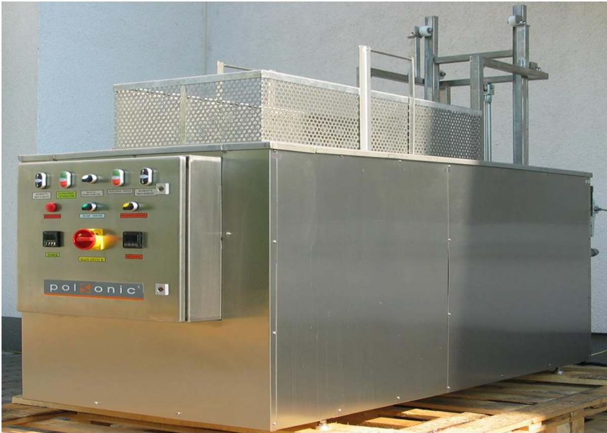
Bilden visar en 160 liters ultraljudsvätt med korglyft.

Genom att förse ultraljudsvättar med en automatisk korglyft uppnås flera fördelar. Förutom att operatören slipper tunga lyft så kommer rengöringen att förbättras och förkortas tack vare den inbyggda agiteringen. Agitering är en upp och nedåt gående rörelse av korgen, vilket även ger en sköljeffekt i hålrum och kanaler. Tvättgodset droppar av i det övre läget. Automatisk styrning av filtersystem och oljeskimmer.