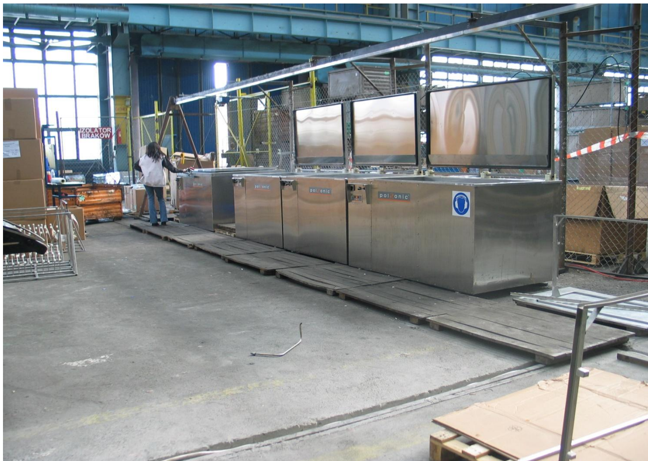
Bilden visar ultraljudsvätt samt sköljtankar

Sköljtankarna är försedda med: Tankar och dess kapsling är tillverkade av höggradigt rostfritt stål AISI 316L. Tankar i 2 mm tjock plåt. Kraftigt utförande. Enkla att rengöra. CE märkta. Termostatstyrd värme. 20 - 80°C. Digital visning. Luftagitering via timer. Digital visning. Påfyllningsventil. Dräneringsventil. Nivåvakt som stoppar värme vid låg vätskenivå. Värmeisolerade. Lock.