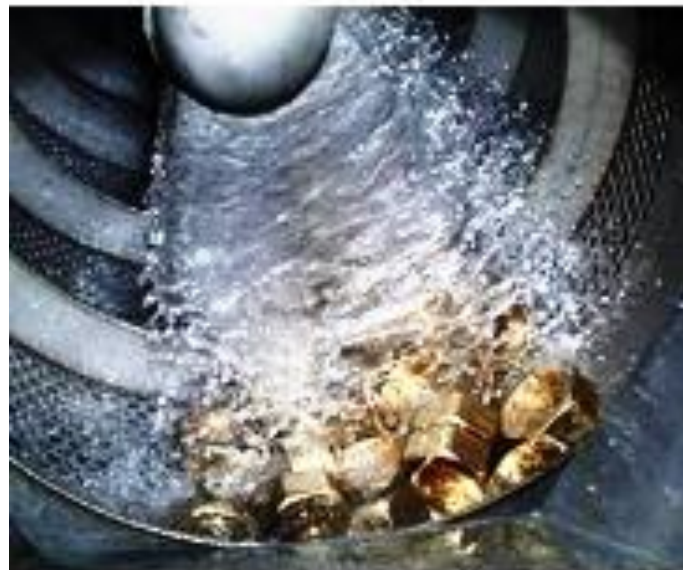
Bilden visar tvättens ingång